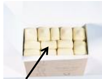
un chocolat blanc