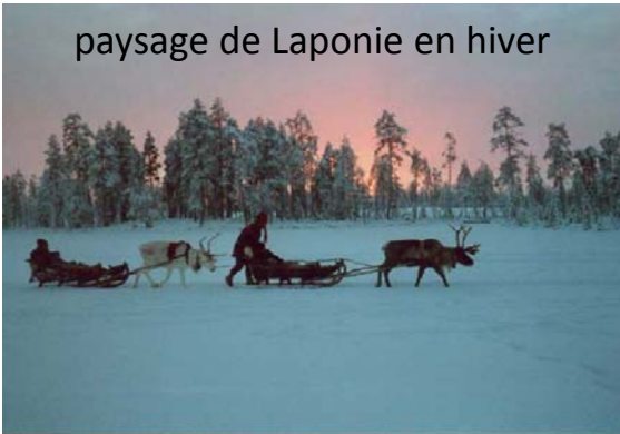
paysage de Laponie en hiver