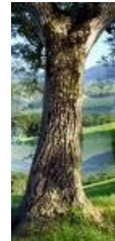
un tronc d'arbre