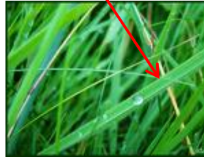
un brin d'herbe